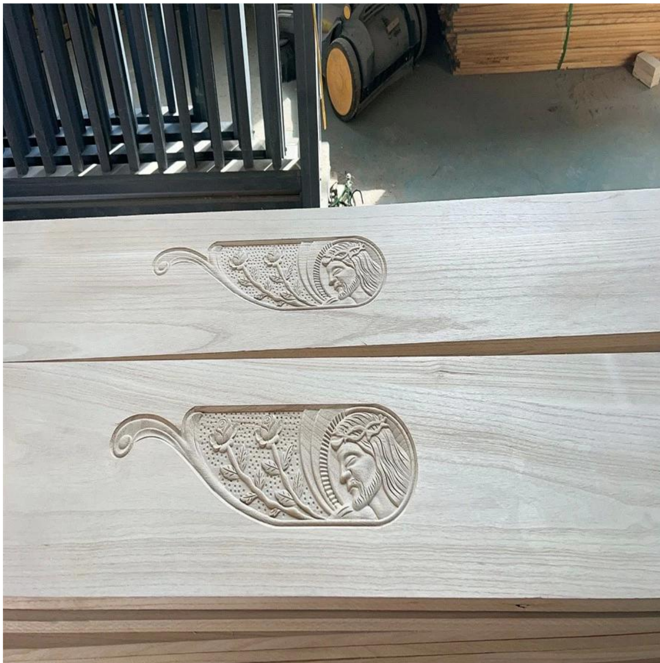
Shantong Paulownia Madera Paulownia Panel de madera maciza para decoración de interiores