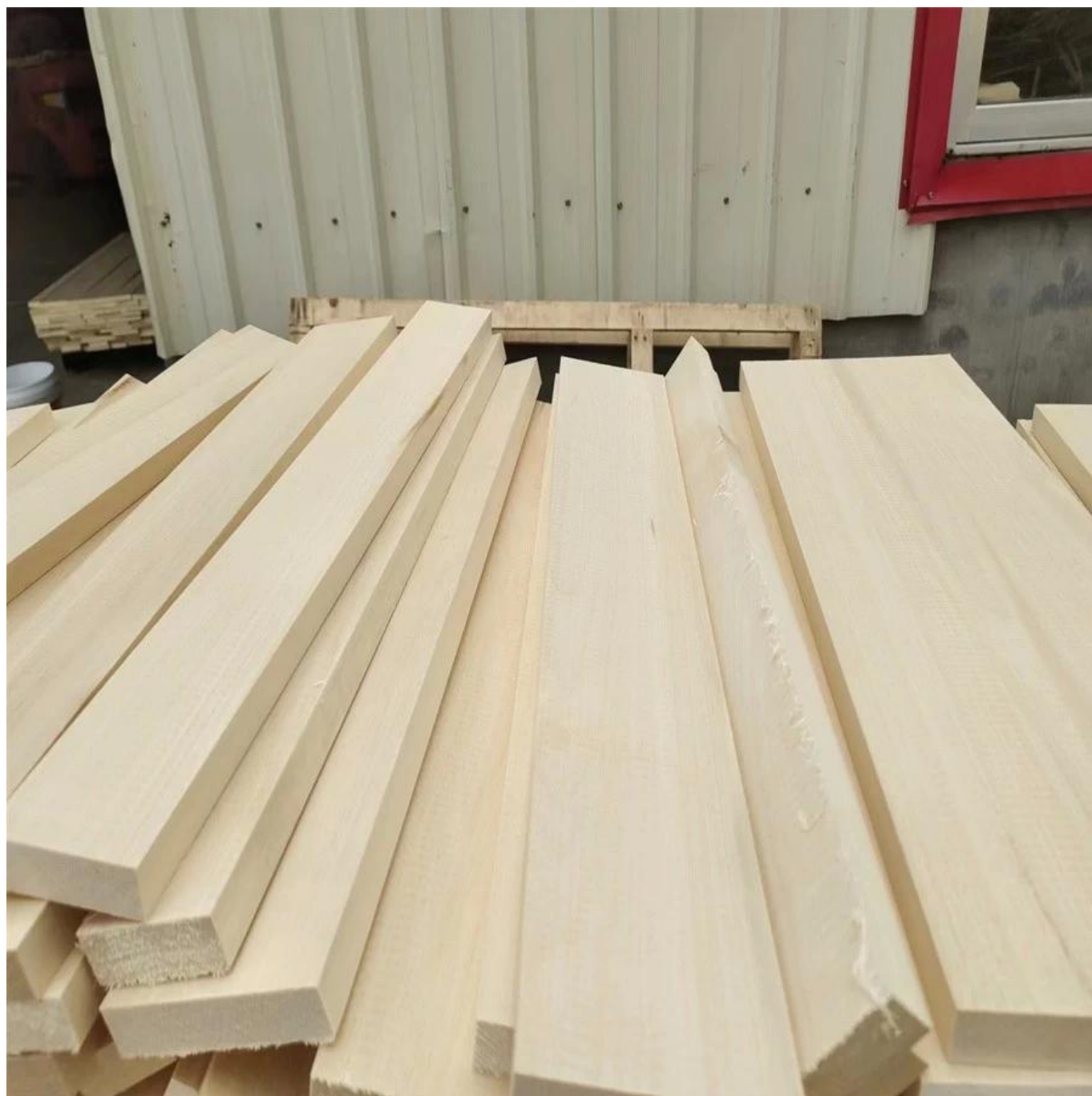
Détail en bois de peuplier